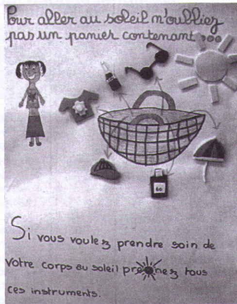
Publicité réalisée par une classe de CM1-CM2.